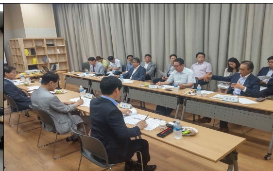
G밸리 발전협의회 실무회의