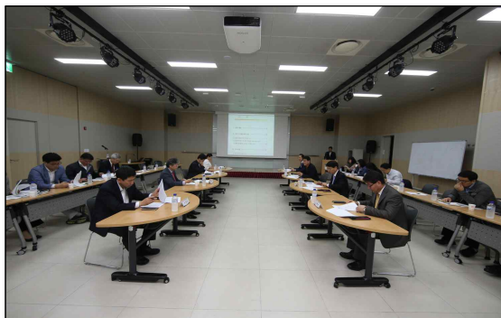
G밸리 발전협의회 본회의