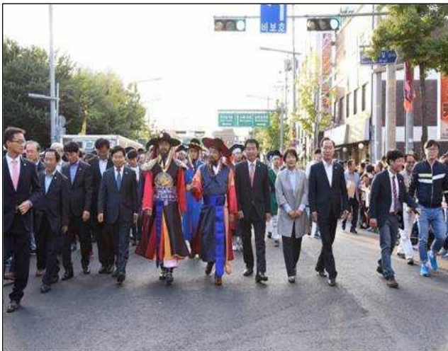
2016년 행사 현장