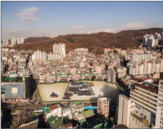
시흥행궁 추정지(시흥5동 830번지 일원)