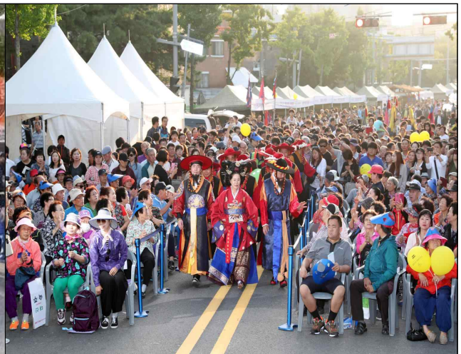
2017년 행사 현장