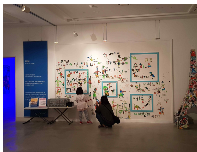
금나래아트홀 갤러리 〈My Dear 피노키오 展〉(5월)