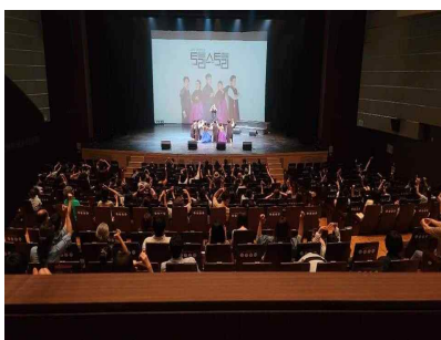
금나래아트홀 공연장 〈상주단체 토리스 공연〉