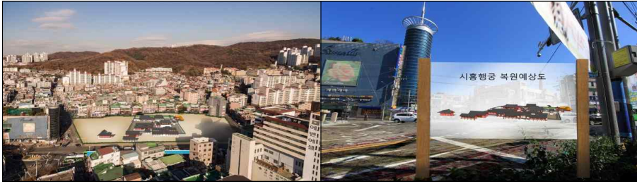
시흥행궁 추정지(시흥5동 830번지 일원)