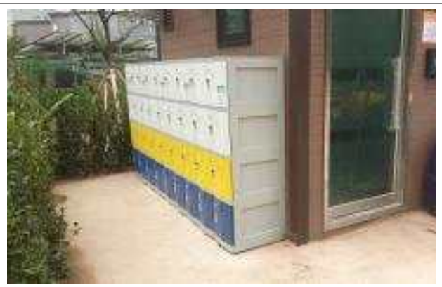
설 치 사 진

작 성 자 공원녹지과장 : 배남현(1650) 팀장 : 강종희 (1661) 담당 : 송대승 (1663)